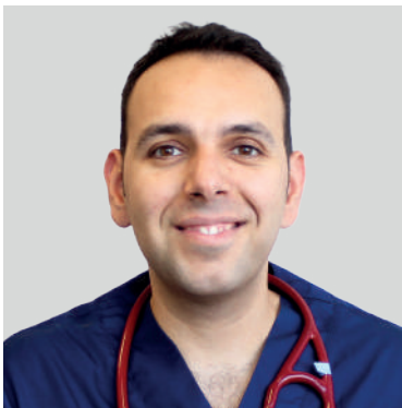
DIRECTOR: LUIS BOSCH LOZANO LV, Msc, Dipl. ACVECC, Dipl. ECVECC

Contamos con un equipo docente formado por algunos de los especialistas clínicos más reconocidos en el sector veterinario, permitiéndonos proporcionar el más alto nivel profesional para hacer frente a los requerimientos teóricos y prácticos de cualquier veterinario clínico.