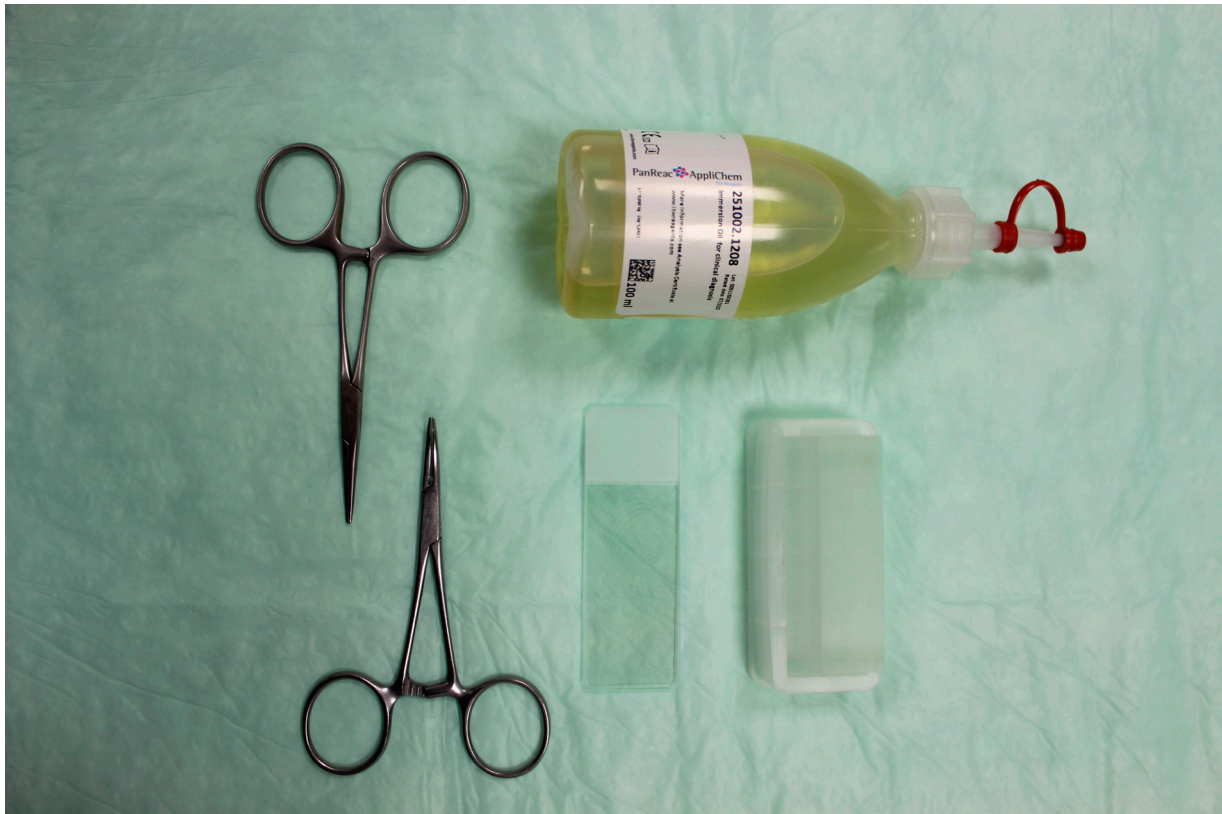
Figura 1: material necesario para la el examen microscópico del pelo