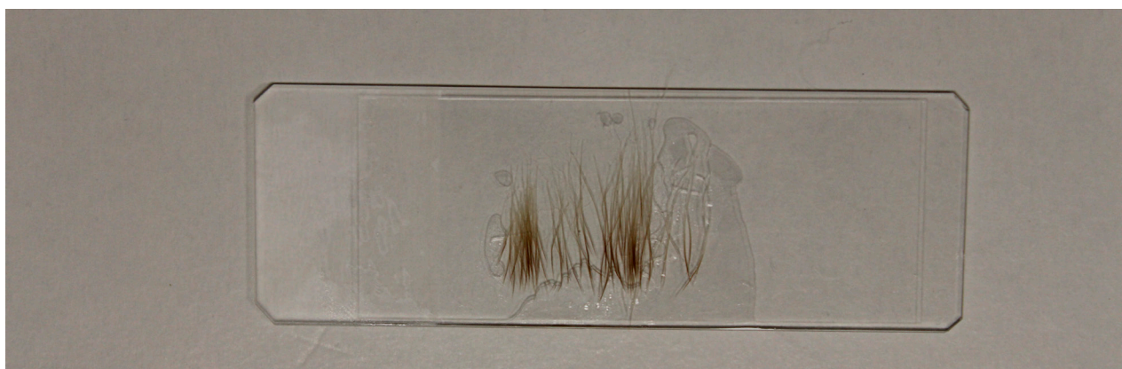
Figura 4: muestra sobre portaobjetos con aceite mineral con pelos paralelos entre sí